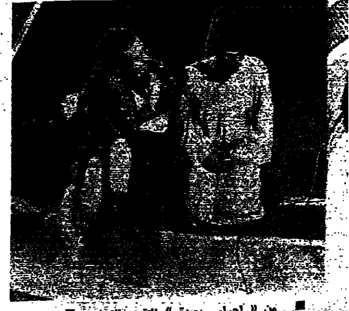
فراتيل ايلي نينج